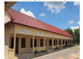
共生ケアン学校寄贈 (2012年9月)