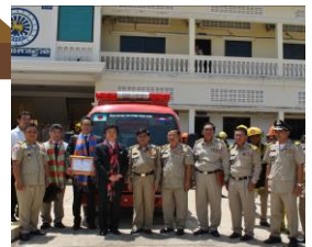
消防車ポンプ車寄贈 (2014年7月)