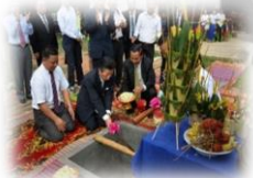
JULY 2014 Ground-Breaking 地鎮祭