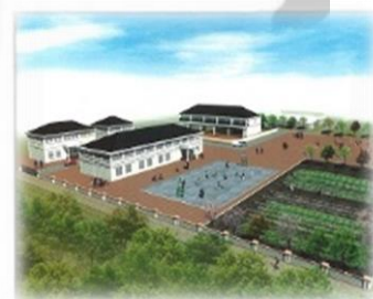
To-be-completed on 22 nd Sep., 2015 2015年9月22日 竣工式