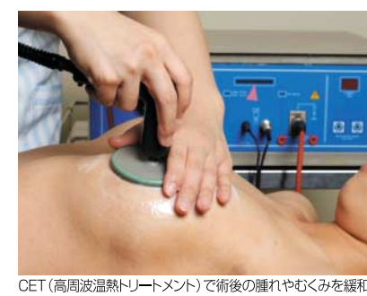
CET (高周波温熱トリートメント)で術後の腫れやむくみを緩和

数十種類のバッグの中から、 私にぴったりの種類と方法を 見つけてくれる カウンセリングでは、不安や疑問 に「いつでも」と説明を受け、シミュ レーションでイメージを確認でき たので、このクリニックなら安心 できると思いました。そのうえで 先生が選んでくれたのがバイオセル バッグを使った「バッグプロテーゼ 挿入法（大胸筋下層法）」だった ときや寝たときのバストの流れも とても自然なのだとか。もちろん、 施術はしっかりと麻酔をかけて 行われたため、痛みなどはまった く感じませんでした。