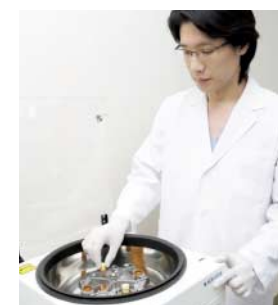
採血した血液から血小板を抽出

自分の血小板を使うという高い安全性 これが施術を受ける決め手に なりました。 そこで私は、実際に「PRP皮膚 再生療法」を行っている聖心美容 外科でカウンセリングを受けてみる ことに。先生の説明によれば、この 治療法は薬で一時的に形を整えるの ではなく、血小板に含まれる成長 因子がコラーゲンやヒアルロン酸の 生成を促し、2週間〜2カ月かけ て肌細胞を活性化させていくとい う療法なのだそう。しかも血小板は 自分の血液から採取したものを 使用するため安全性が高く、副作 用などの心配もないという点が気 になりました。