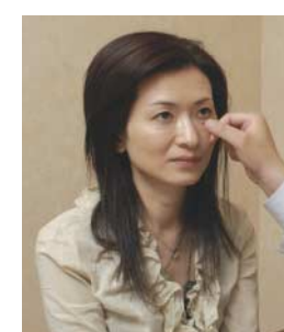
まずはじっくりカウンセリング

友人に「老けたね」と 言われて大ショック！ 自己流のケアでは限界なの？ 数カ月前に行った同窓会で久しぶ りに友人に会ったときに言われた「老 けたね」という一言。私自身も鏡を 見るたびに、なんとなく目の下あたり に小ジワやタルミを感じていただ けに、「これはどうにかしなくては シワやタルミに効くという高い化粧品 を購入。せっせと塗り込む日々が 始まりました。それから約1カ月。 あんなに毎日がんばったのに、思った ような効果が表れない。私は自己流 のケアに限界を感じていました。そん なときにインターネットで見つけた のが「PRP皮膚再生療法」でした。