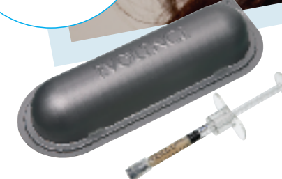
エポレンス注入って?

「恋のから騒ぎ」第12期生。 (最前列) CanCam・AneCan・ JJ・Ray等の雑誌でも読者モ デルとして活躍。現在はフリ ーで、モデルやレポーター などのお仕事に大活躍!