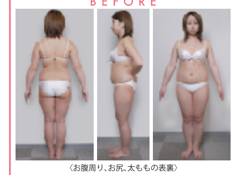
(お腹周り、お尻、太ももの表裏)

実際に施術されたのは「エルコーニアルレーザー脂肪吸引」。FDA認可の安全な低出力レーザーを使用した