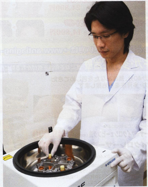
採取した血液を遠心分離機にセットし、6分間回転させると、血小板と他の成分が分離する。そこから血小板だけを取り出して、小ジワが気になる部位に注入していく。このACR皮膚再生療法は、火傷の治療などに用いられている技術を美容分野に応用したもの。ちなみにACRとは、Autologous Cell Rejuvenationの頭文字で、「自分の細胞をよみがえらせる」という意味。

違和感なくナチュラルに ちりめんジワを解消！ これまでもシワを解消するのに、ヒューマンコラーゲンやヒアルロン酸を注入する方法があったけれど、異物を入れることにごくごくで抵抗があったのも事実。実際、浅いシワには不向きで、皮膚が盛り上がり過ぎて不自然になることも多かった。けれども、自分の組織を使って、ナチュラルに小ジワを解消できるとしたら？それが、日本の美容医療業界をリードしている聖心美容外科がいち早く取り入れた「ACR皮膚再生療法」だ。