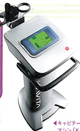
◀キャビテーション マシン「KAVITA」

施術着に着替え、施術開始! まずは太ももにジェルを塗り、脂肪をつかみながら超音波をあてていく。超音波が骨に伝わるビリビリとした刺激がたまにあるが、痛みはなし。温かくて気持ちいい、エステのような感覚! 施術は看護師さんがやってくれる。